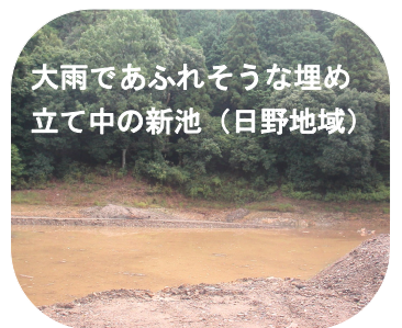
大雨であふれそうな埋め立て中の新池（日野地域）